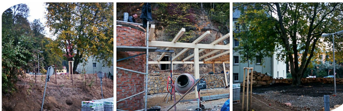
Střípky z parku, konec září 2015