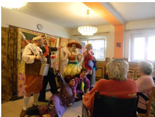
Divadelní soubor Karel Čapek